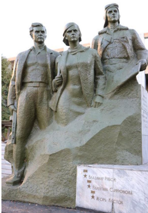
Памятник «Трем героям»: Валентине Сафроновой, Владимиру Рябку, Игорю Кустову., 1970г.

Место захоронения Валентины Сафроновой до сих пор неизвестно.